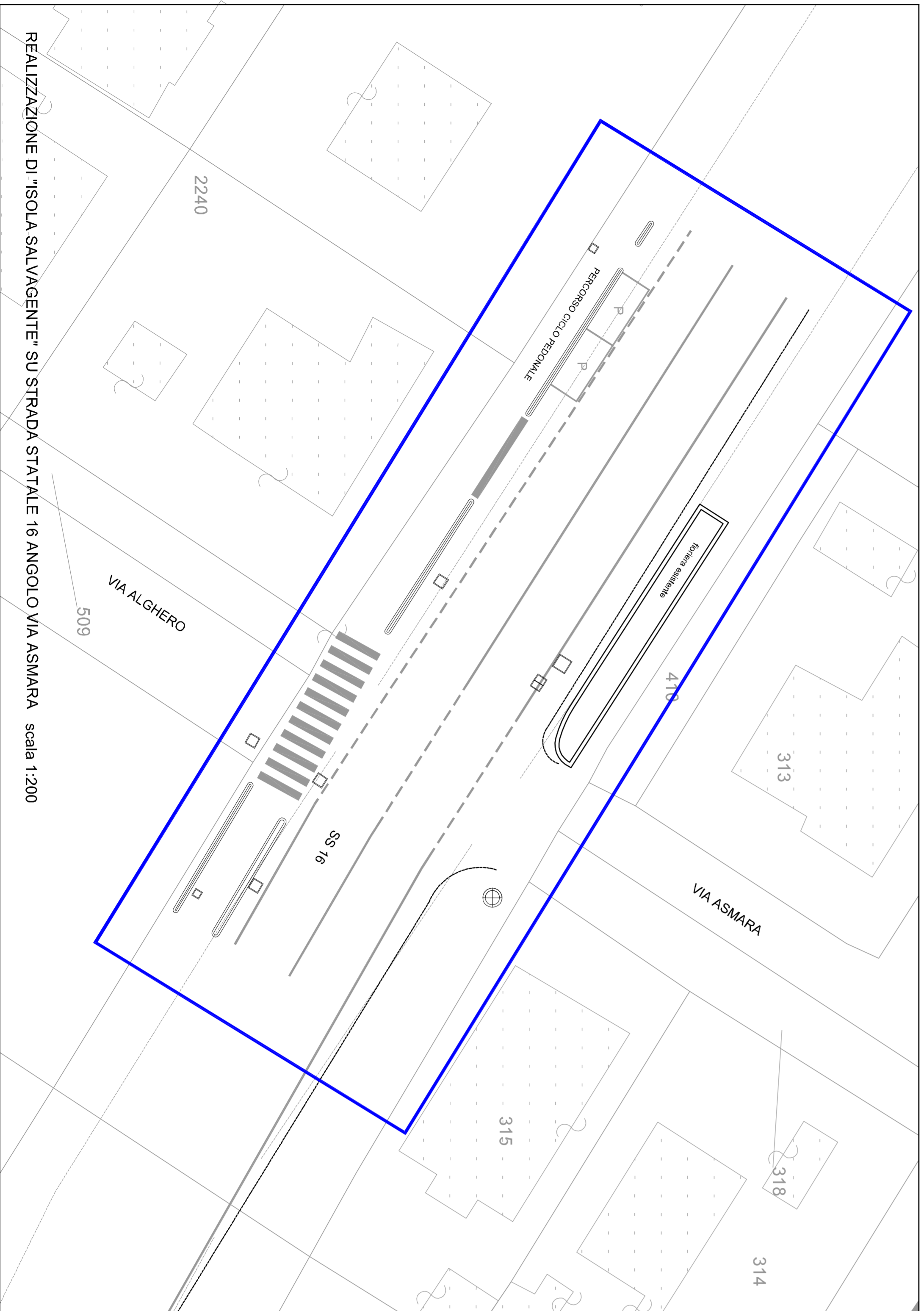
REALIZZAZIONE DI "ISOLA SALVAGENTE" SU STRADA STATALE 16 ANGOLO VIA ASMARA scala 1:200

INDIVIDUAZIONE DELL'AREA DI ATTRAVERSAMENTO DOVE REALIZZARE L' "ISOLA SALVAGENTE" SULLA STRADA STATALE 16 ANGOLO VIA ASMARA