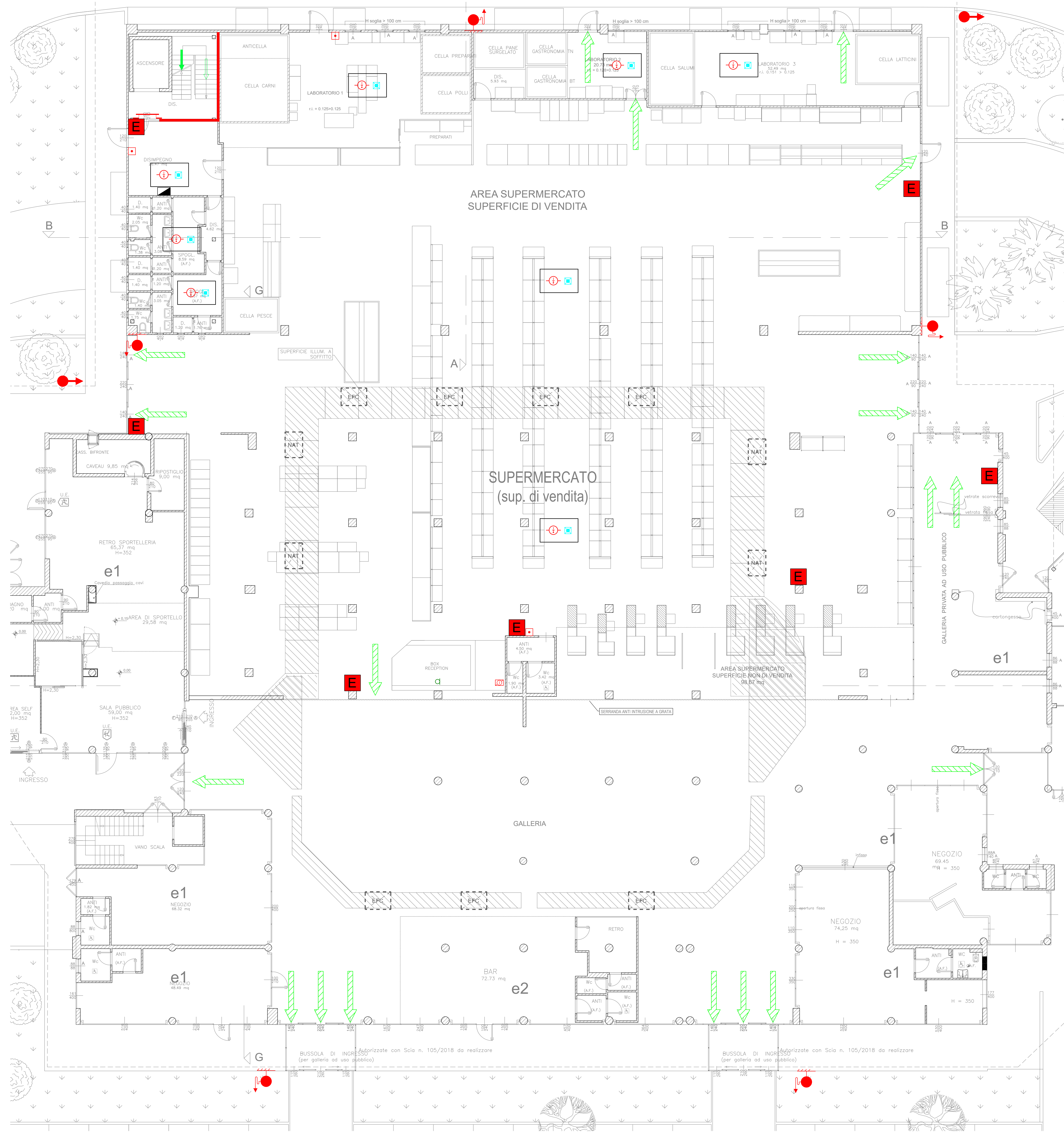
PIANO TERRA SCALA 1:100