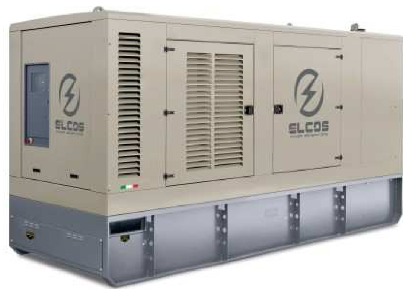
IMMAGINE TIPO DEL GRUPPO ELETTROGENO DA ESTERNO