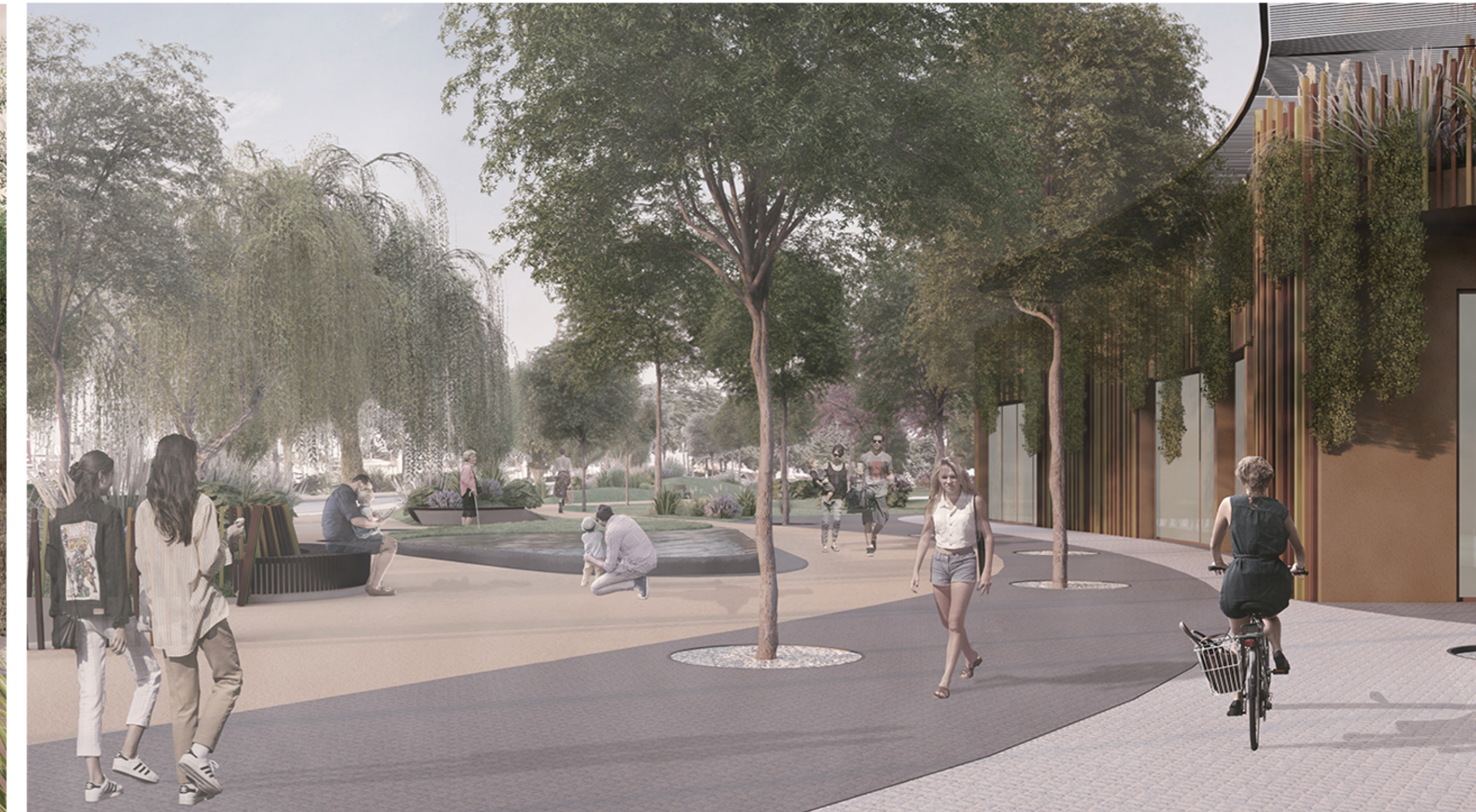
VISTA SU PIAZZA FONTANELLE