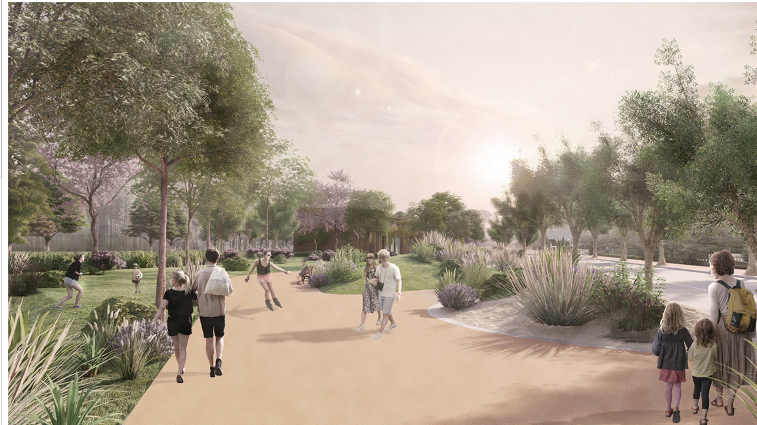
VISTA DEL VIALE PEDONALE