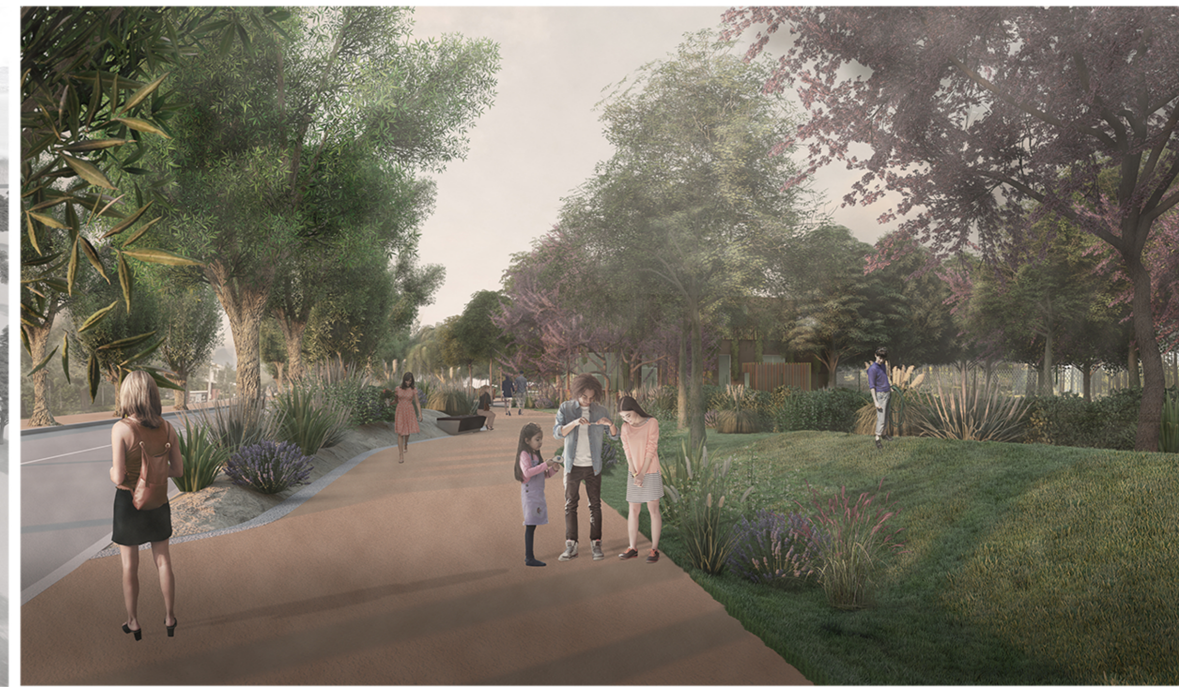
VISTA DEL VIALE PEDONALE