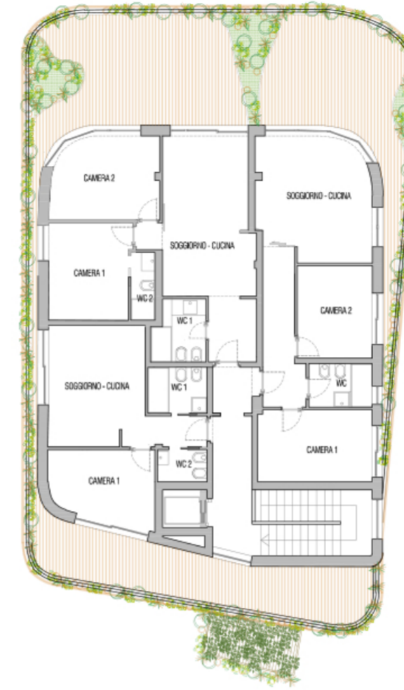
PIANTA PIANO PRIMO RECEPTION SCALA 1:200