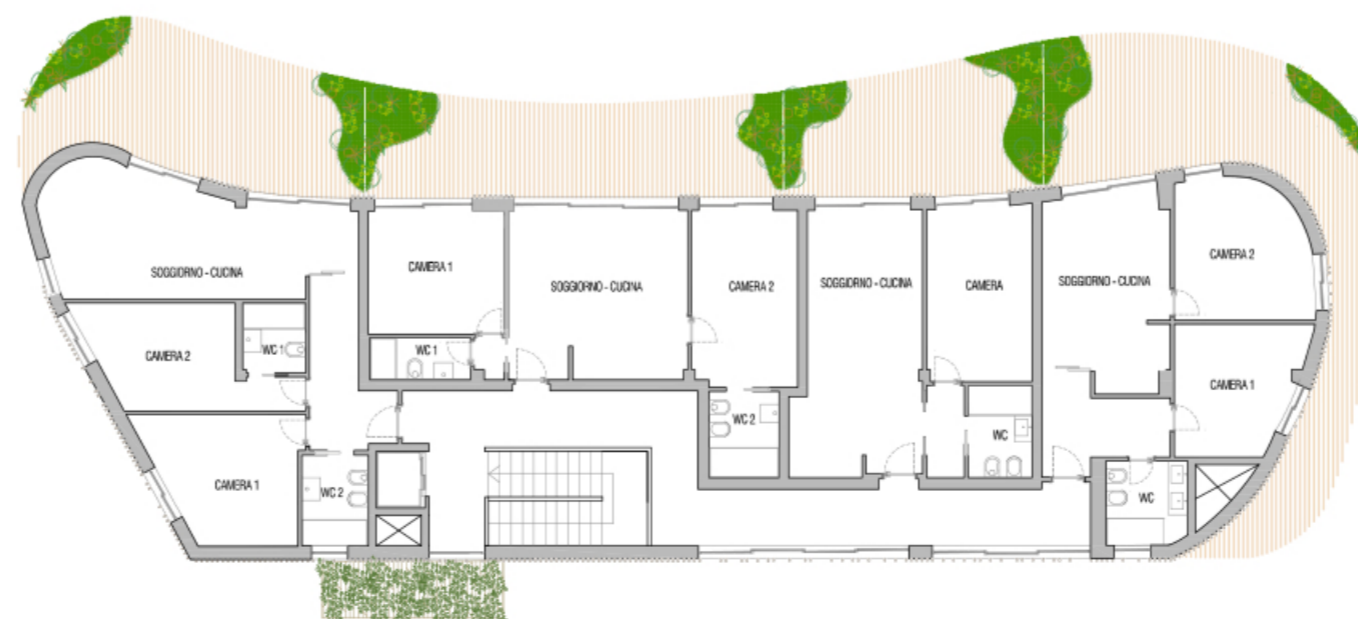
PIANTA PIANO PRIMO BAZAR SCALA 1:200