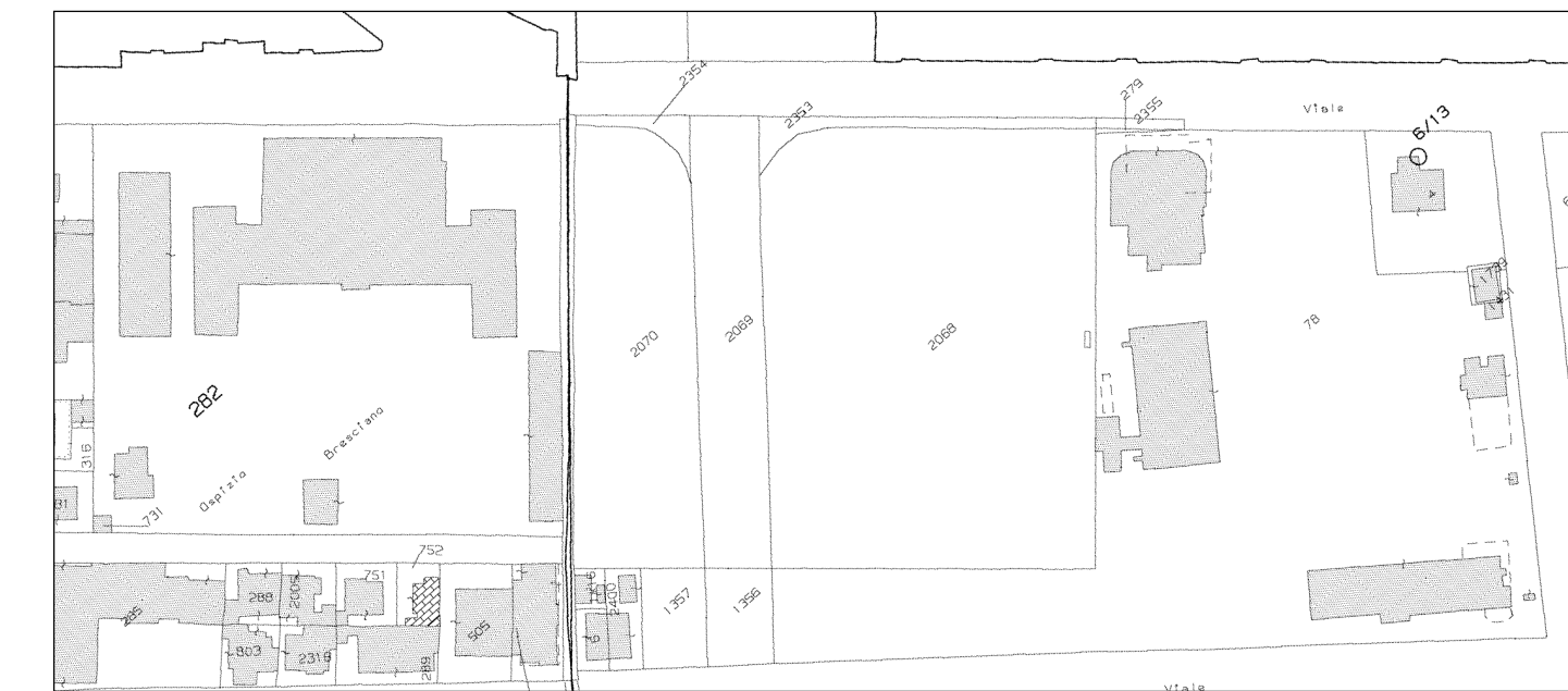
PLANIMETRIA CATASTALE - SCALA 1:2000