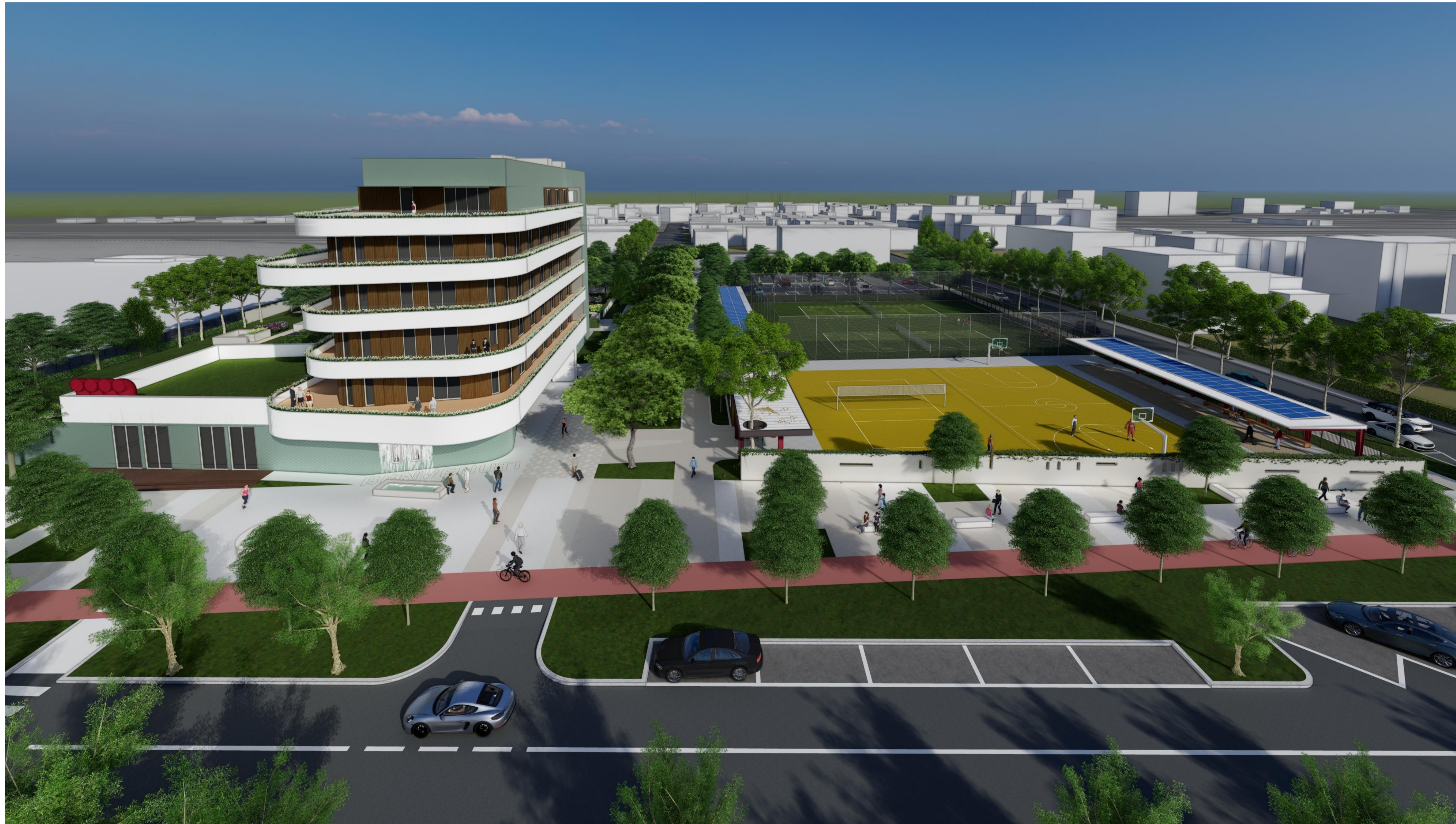
V12 - VISTA D'INSIEME DA VIA TORINO