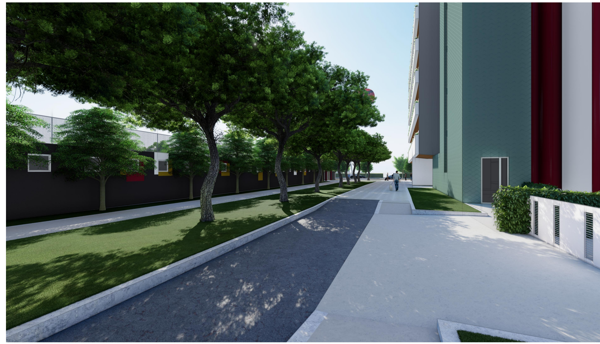
V11 - VISTA DA VIALE BERNINI VERSO VIA TORINO