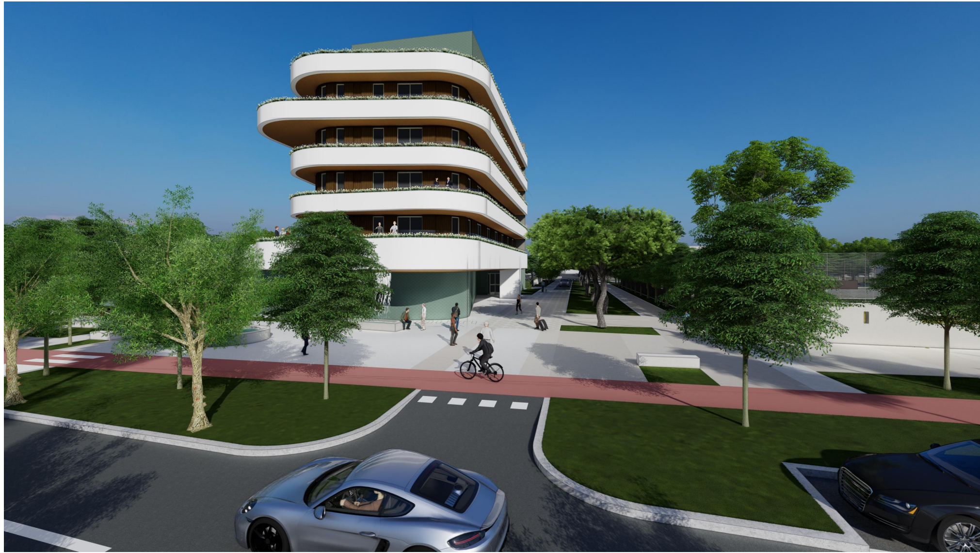
V1 - VISTA DI VIALE BERNINI DA VIA TORINO