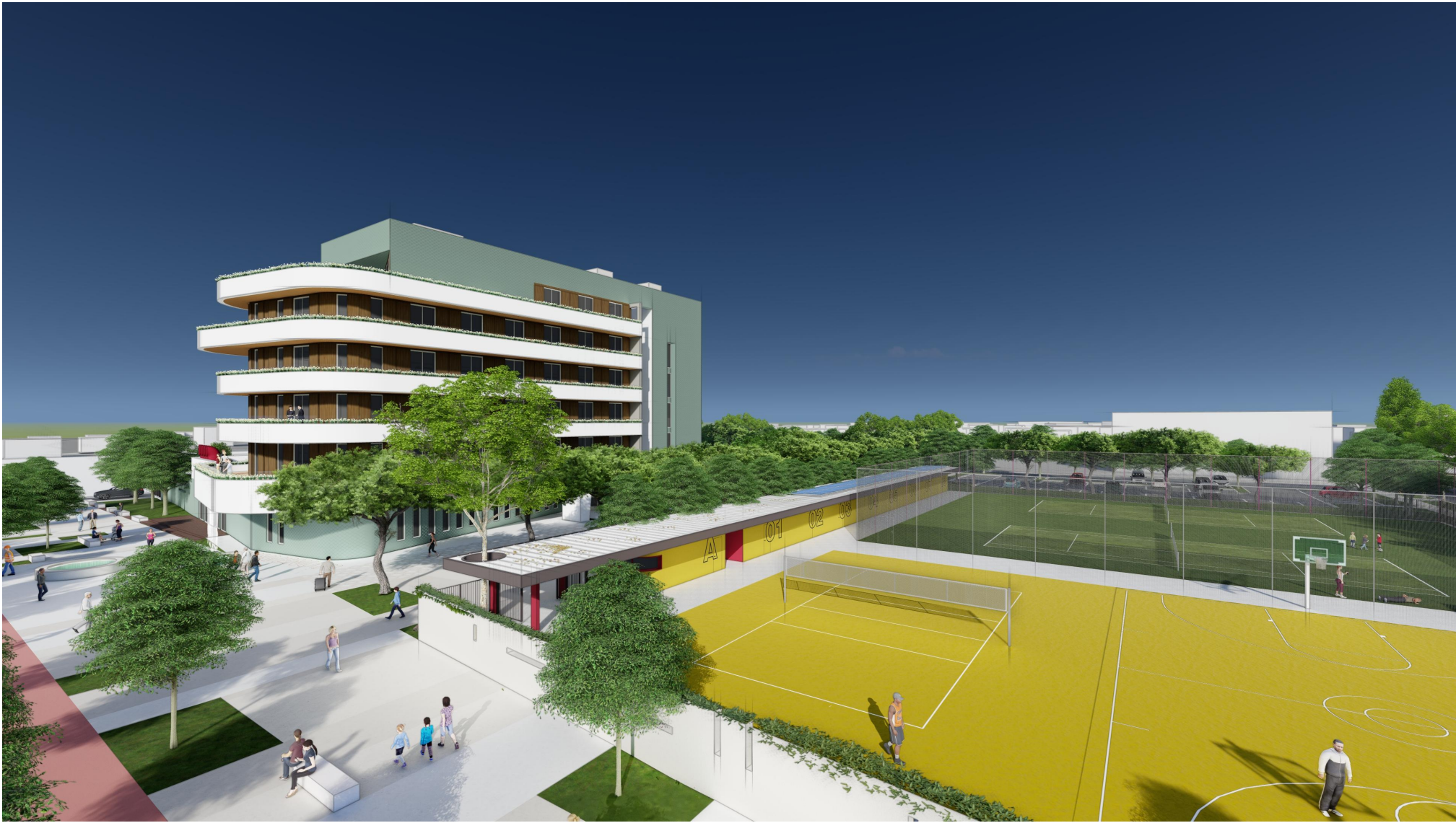
V2 - VIA TORINO - HOTEL E CENTRO SPORTIVO