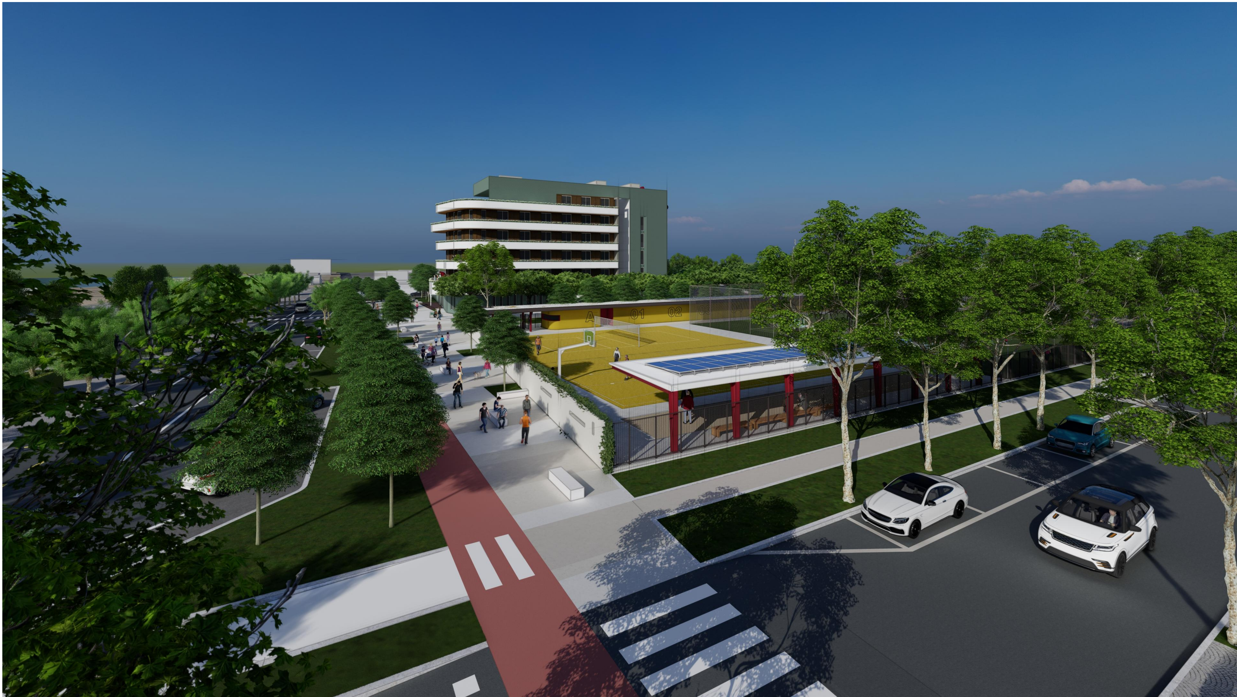
V3 - VISTA DI VIA TORINO ANGOLO VIA BRAMANTE