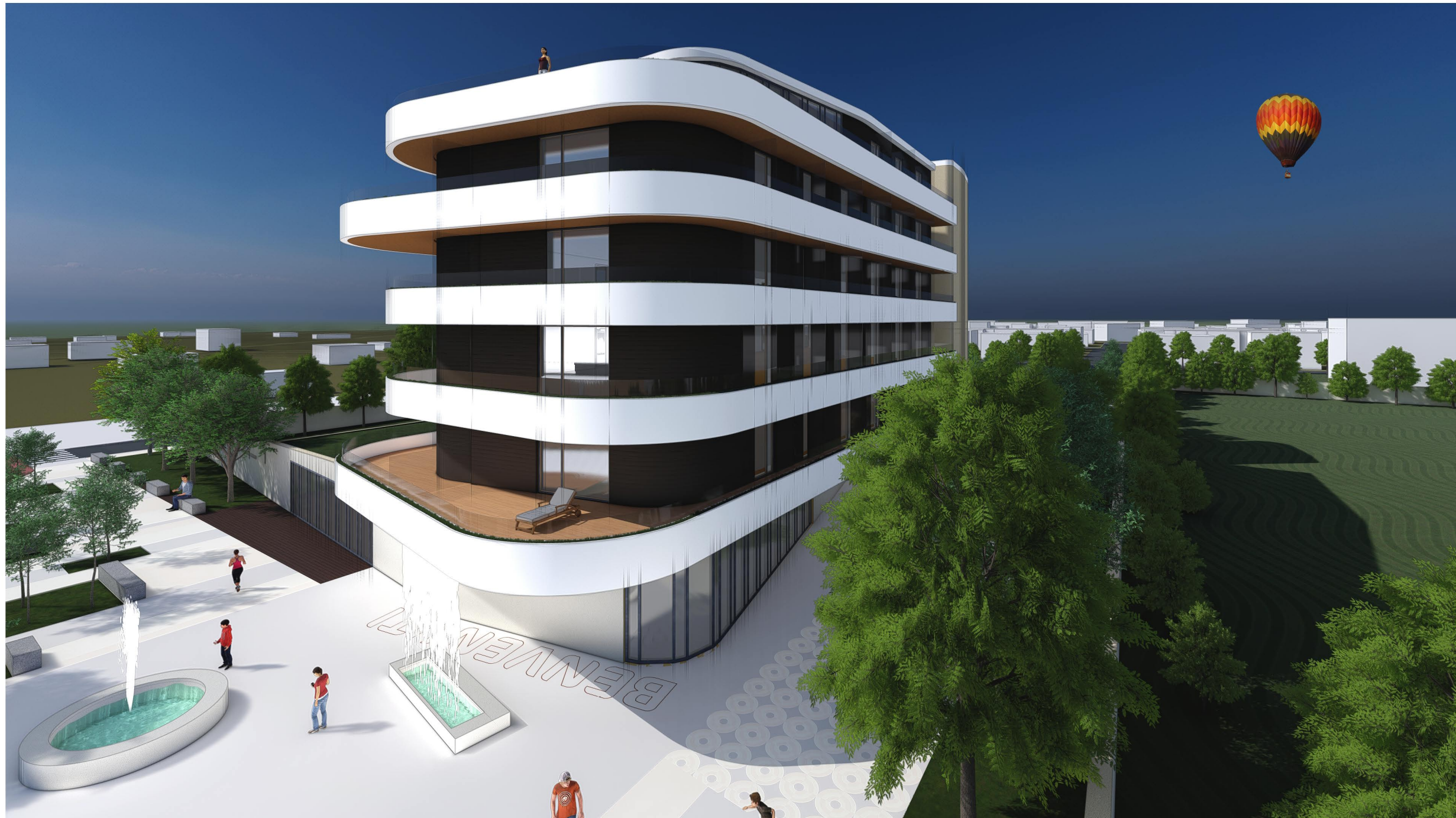
VISTE DEL PROGETTO fuoriscalcala